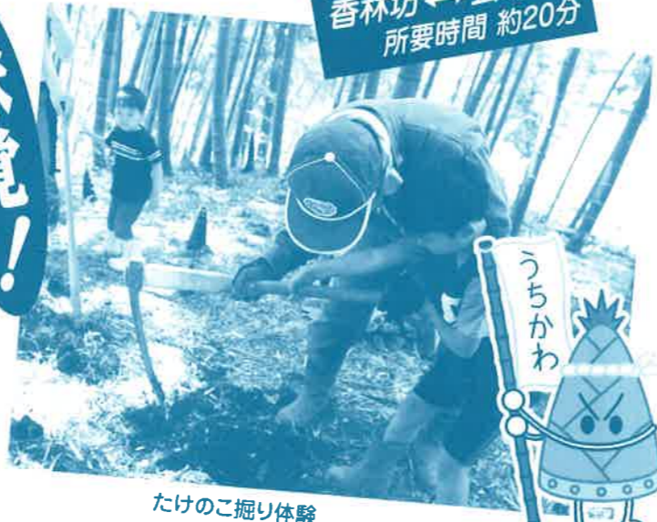
たけのこ掘り体験