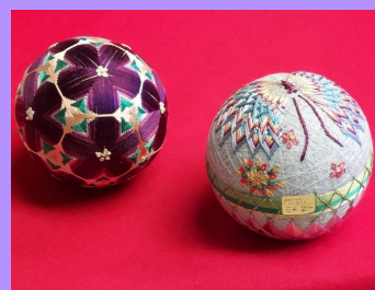
【逸品】ミュージアムショップで、加賀手毬などの美しい金沢クラフトを購入することができます。加賀手毬 S/M/L ¥4,400（税込）より