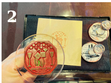
【受付】館内ガイドツアーへの参加申し込み・集合場所。ラウンジには界限マップや記念スタンプも設置しておりますので、旅の思い出にぜひどうぞ。