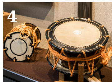
【触れる】普段、ミュージアムでは触れることが出来ない邦楽楽器をガイドの案内で触ることができます。