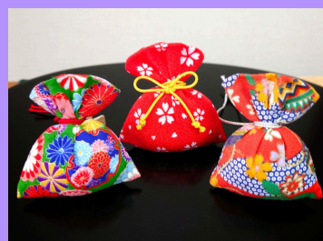
【体験】ミニ文化体験（うちわ・扇子作り 畳コースター・だるま絵付け・香袋）で金沢の「粋」を形にできます。所要時間15分 程 ¥1,000（税込）より