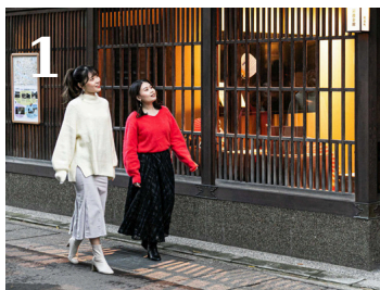
【散策前】木虫籠（きむすこ）が印象的な金沢の町屋。外へこぼれる光に訪れる旅人は心奪われます。フォトジェニックな景観をお楽しみください。

浅野川。この流れが育んだひがし茶屋街、主計町、卯辰山麓の三地区は、多くの文人墨客にも愛された、情感あふれる美しい街並みです。木虫籠（きむすこ）の向こうに潜む文化の「粋」、そして川風に揺らめく人々の「情」の物語。この街の奥深い魅力を知らずに歩くのは、あまりにも惜しい。旅の始まりは、ぜひ「金沢 浅の川園遊会館」へ。