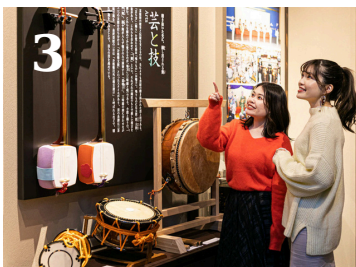
【展示】ジオラマや映像で、茶屋文化の華やかさや、美しい町並みを守り抜いた歴史を分かりやすく解説。「なぜここが特別なか」の答えが見つかります。