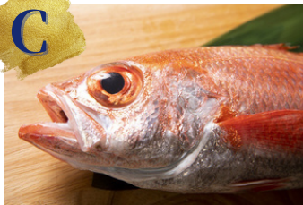
のどぐろ料理 あ才

<食事>小鉢、刺身、のどぐろ治部煮、のどぐろ茶碗蒸し、香箱蟹とのどぐろの釜めし1人1台、味噌汁、アイス