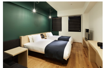
ザ・スクエアホテル金沢