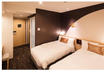
ホテルビスタ金沢