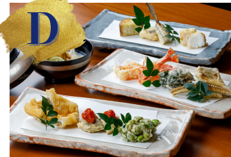
天麩羅専門店 天金