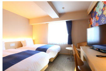
ホテルウィングインターナショナルプレミアム金沢駅前