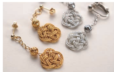
金沢水引ワークショップ

結納は昔から日本で行われている婚約の形式で御両家の婚約成立を祝う儀式です。創業からのべ8,000組以上の婚礼行事に関らせていただきました。全国各地の「結納」を知り尽くしたスタッフがわかりやすくサポートさせていただきます。御結納のことなら形式・段取りなど当店へご相談ください。