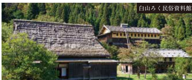
白山ろく民俗資料館