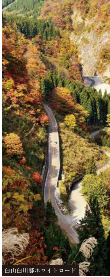
白山白川郷ホワイトロード

歴史的建造物や街並みだけでなく、国内外から注目を集める観光スポットがある金沢。 霊峰白山の麓では、日本屈指の急流河川・手取川が描く峡谷と扇状地の風景が楽しめます。 観光とアクティビティを両方楽しめる旅。