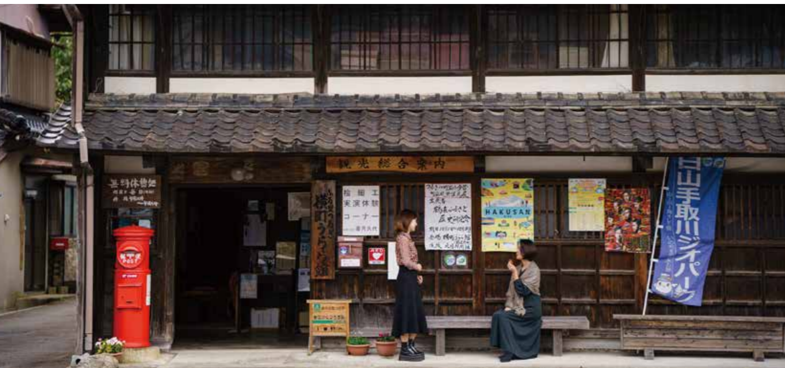
「金沢」から「白山」へ ～異なる表情を楽しむ新しい旅～