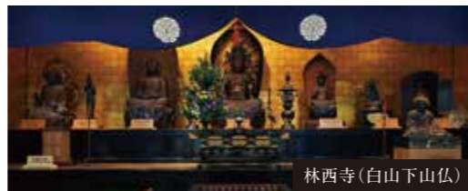
林西寺(白山下山仏)