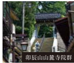
卯辰山山麓寺院群